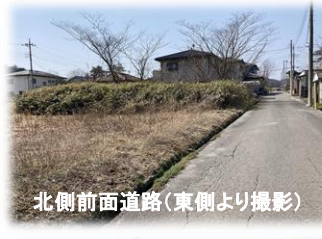
北側前面道路(東側より撮影)