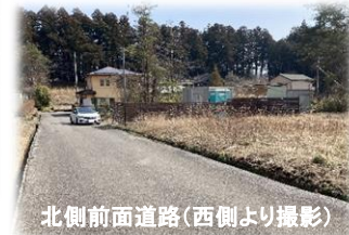
北側前面道路(西側より撮影)