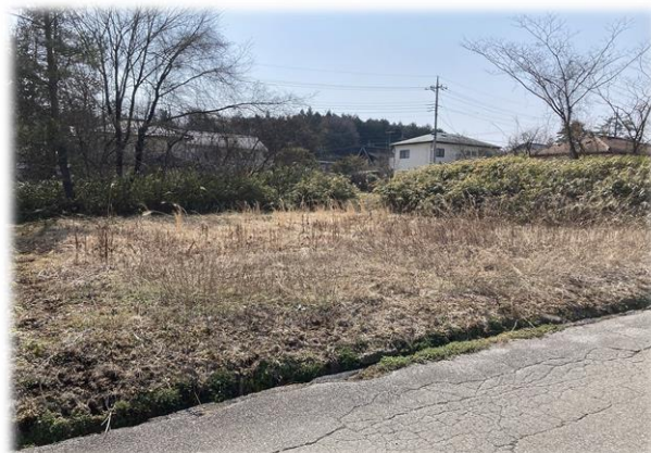
北東側より撮影現地土地 【掲載写真: 2024年4月撮影 ※街並み含む】